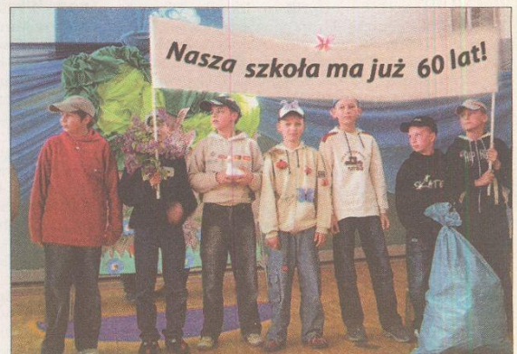
Opracowanie i zdjęcia Malwina Mazurkiewicz i Sylwia Włodarczyk